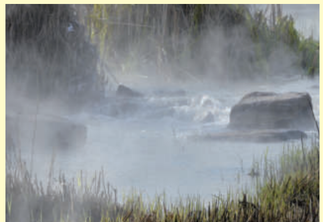
Wassergärten in Landsweiler-Reden