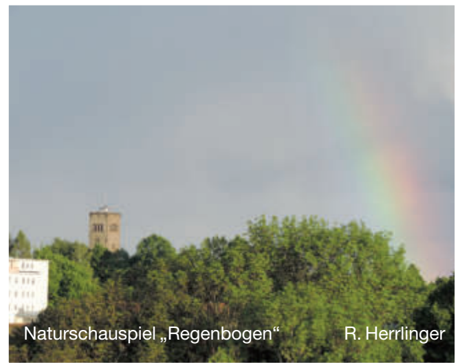
Naturschauspiel „Regenbogen“ R. Herrlinger