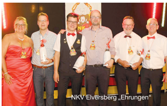
NKV Elversberg „Ehrungen“

Mitglied im Deutschen Gutachter und Sachverständigen Verband e.V.