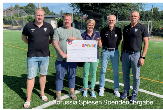
Borussia Spiesen Spendenübergabe

INFORMATIONEN rund um den Galgenberg Nr. 826/ 28.7.2023 Jahrgang 38