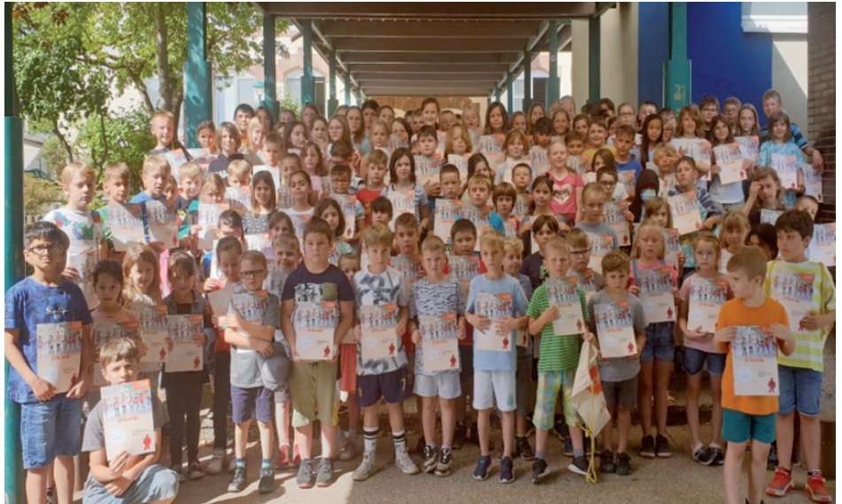
Das Bild zeigt die erfolgreichen Teilnehmer und die glücklichen Gewinner der Grundschule Spiesen, Mittelbergschule.

Internet: www.spospito-bewegungspass.de/