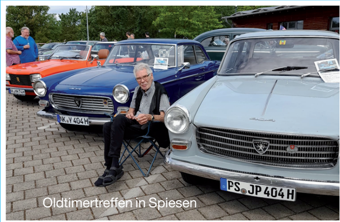
Oldtimertreffen in Spiesen