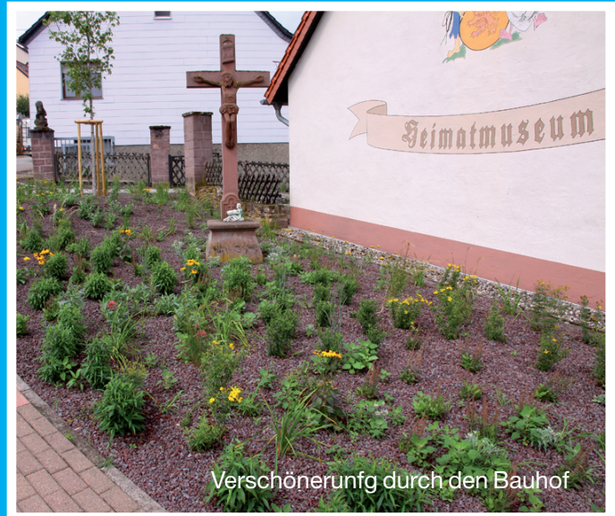
Verschönerung durch den Bauhof